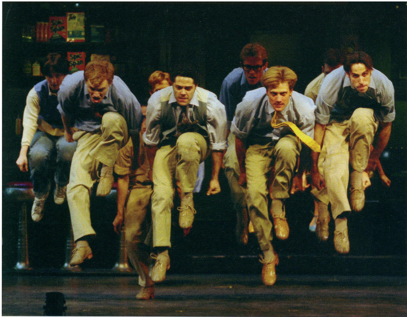
West side story Chorégraphie créée par Jérôme ROBBINS