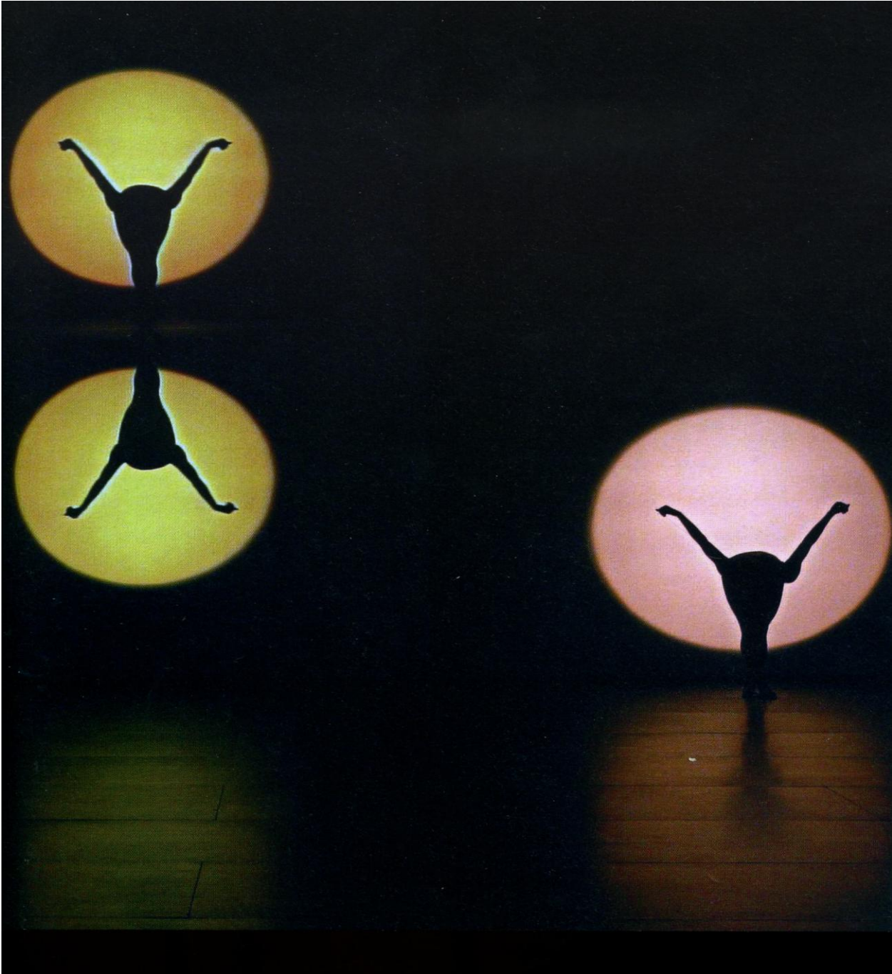
Iris Chorégraphie de Philippe DECOUFLE